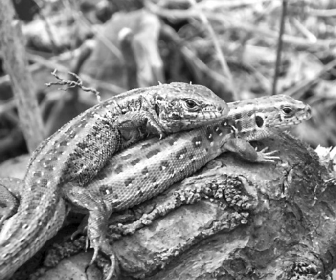
Zauneidechsen «uf der Höchi»