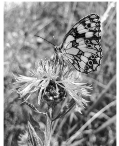
Schachbrettfalter auf Flockenblume «Schwarzacker»