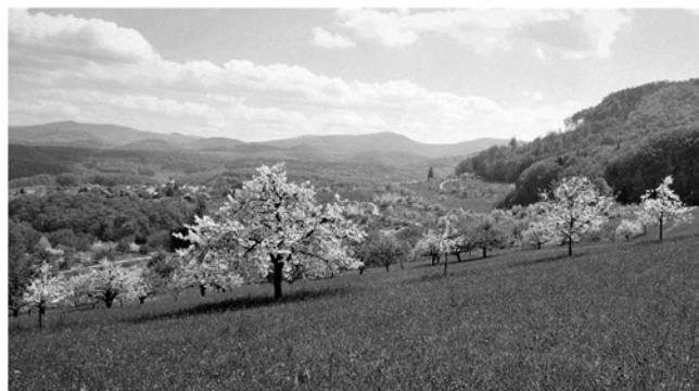
Typische Schweizer Kulturlandschaft in St. Pantaleon

Die Kirschen-Produzent*Innen sind frustriert. Der traditionelle Streuobst-Anbau scheint nicht mehr möglich. Gleichzeitig aber besteht eine Nachfrage nach diesem hochwertigen Obst. Der Schutz der Biodiversität und des Klimas wird immer wichtiger. Zu beidem trägt der Hochstammanbau mit seinem artenreichen Lebensraum und seiner Sortenvielfalt bei. Neben der Wasserspeicherfunktion fördern Hochstammbäume das Mikroklima und schützen den Boden vor Erosion, was sie in Kombination mit Ackerkulturen oder Weiden in sogenannten Agroforstsystemen interessant macht. Sie speichern CO 2 aus der Atmosphäre, und machen sich so für das Erreichen von Klimazielen interessant. Bereits haben sich erste Firmen bei Hochstamm Suisse gemeldet, um in Klimakompensationsprojekten die Pflanzung von Hochstamm-