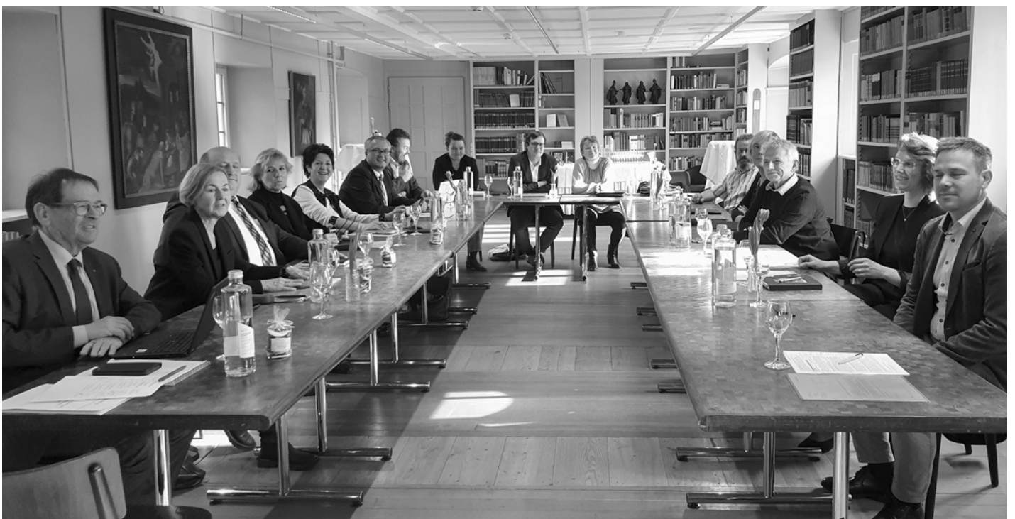
Staatsschreiber, Gesamtregierungsrat und Delegationen der Gemeinden trafen sich in der Bibliothek des Klosters Dornach.

und die Aufgabenteilung zwischen Gemeinden und Kanton. Im Anschluss konnten beim Apéro richte Kontakte gepflegt und individuelle Fragen geklärt werden.