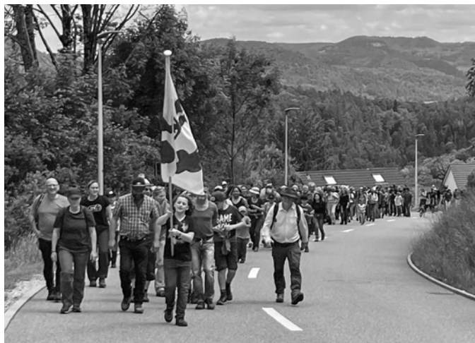
Impression vom Banntagmarsch 2022

GEMEINDERAT und FORST-, NATUR- UND LANDSCHAFTSKOMMISSION